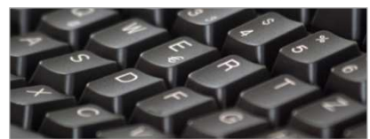
EDV Hard- und Software

Dank unserer langjährigen Erfahrung können wir Ihnen garantieren, dass Sie mit unseren Ausschreibungsunterlagen und unserer professionellen Bearbeitung, das wirtschaftlich günstigste Angebot für Ihr Projekt bzw. Ihre Neuananschaffung finden.